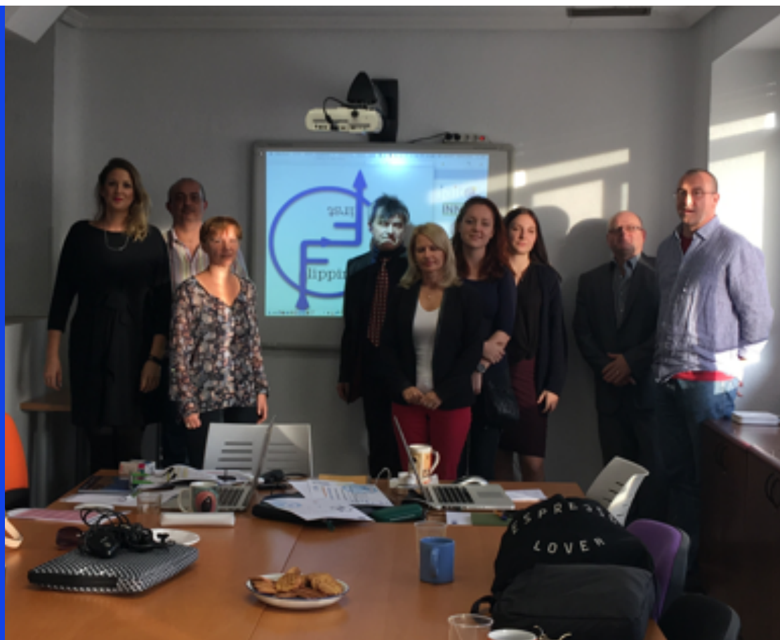
Spotkanie inauguracyjne projektu Flipping Framework Including VET Resources for Social Training