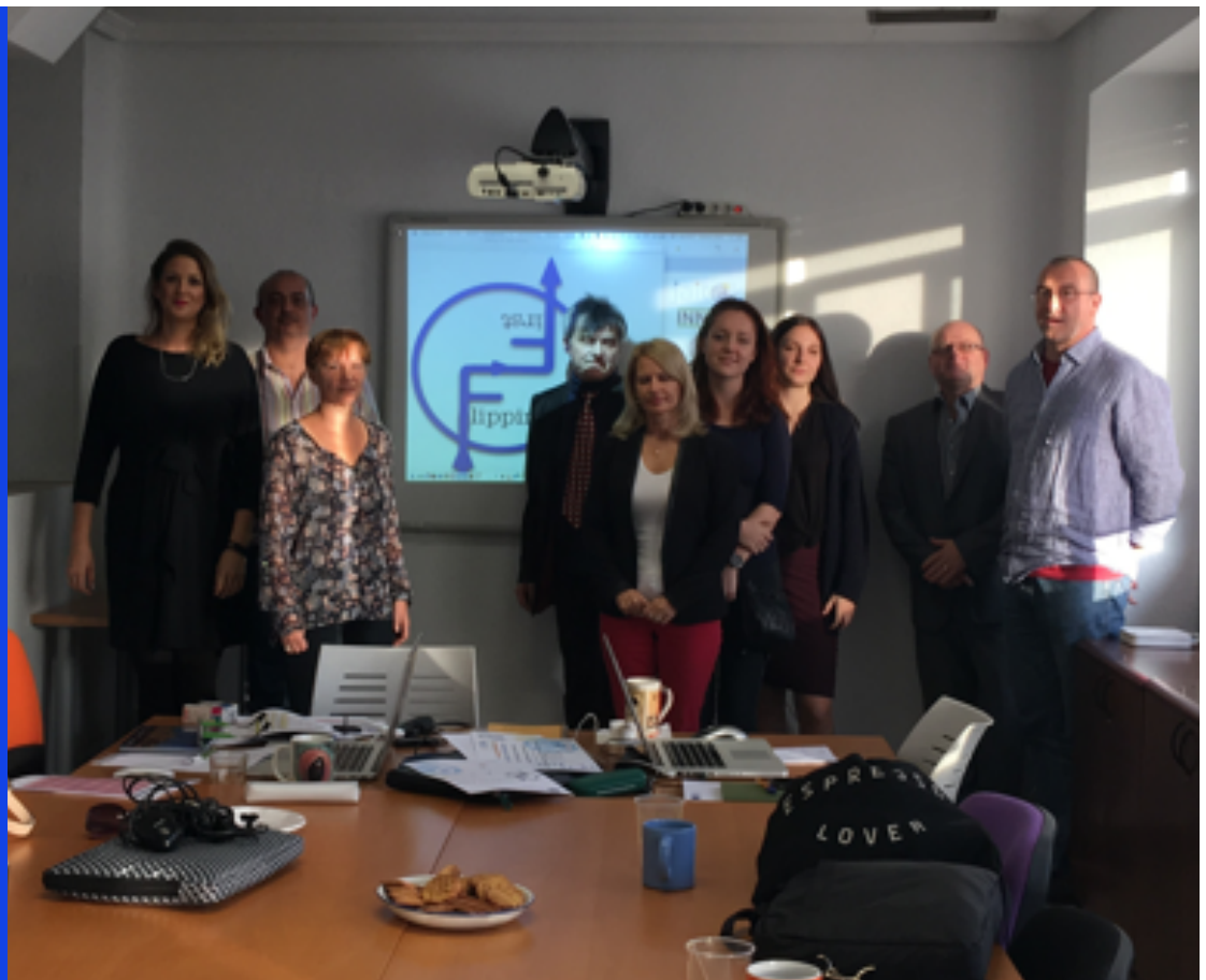
Kick-off meeting Flipping Framework inclusief MBO bronnen voor Sociale Trainings doeleinden